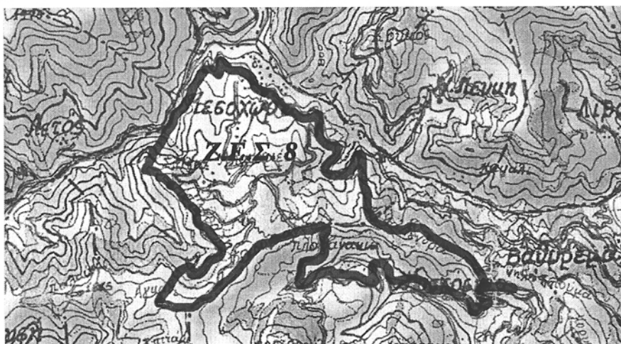
(Ζ.Ε.Σ. 8) Μεσοχώρας και Μοσχόφτου Δήμου Πύλης